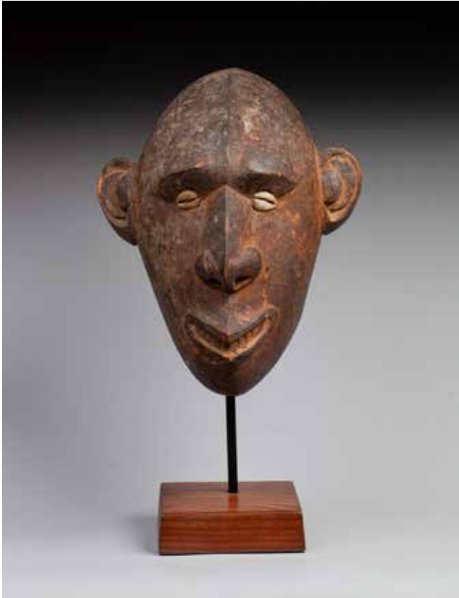
8 - Tête utilisée au cours des rituels guerriers symbolisant un ennemi vaincu, à la belle expression intériorisée Bois dur, traces de pigments naturels et patine d'usage brune Région du Moyen Sepik, Papouasie Nouvelle Guinée, XXe siècle 29 x 21 cm Provenance Collection privée, New York 1500/2500 €