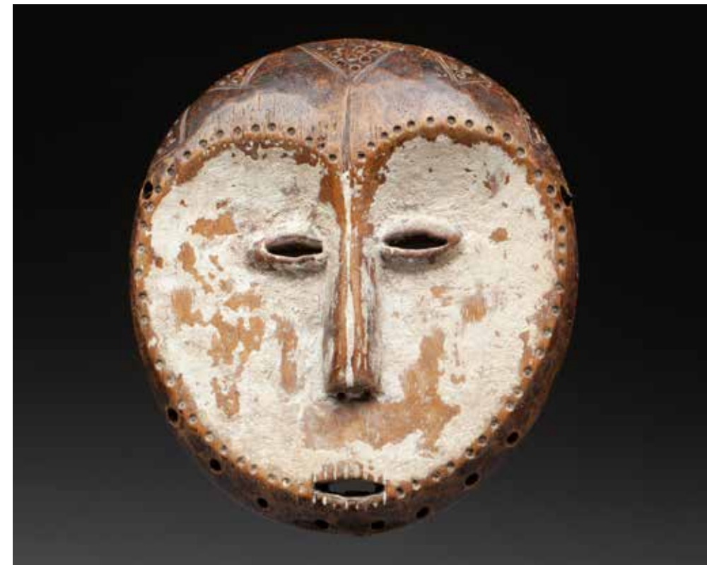
190 - Masque de grade utilisé au cours des rituels de la société initiatique du Bwami. Il présente un visage à la belle expression lunaire s'inscrivant dans un espace en forme de cœur stylisé. Sa bouche est ouverte, agrémentée de motifs incisés symbolisant un grand initié qui a le droit de prendre la parole. Bois, pigments naturels blancs, ancienne patine d'usage miel et brune. Lega, République Démocratique du Congo, début du XXe siècle 21 x 19 cm

Provenance vente Sens-Enchères, Sens, 8 octobre 2005, lot 286