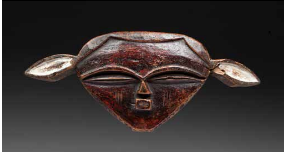
188 - Masque présentant un visage aux traits cubistes surmonté de deux grandes oreilles de lièvre (animal lunaire associé aux semailles). Bois, pigments naturels, anciennes marques d'usage internes. Pendé orientaux, République Démocratique du Congo, XXe siècle 50 x 15cm