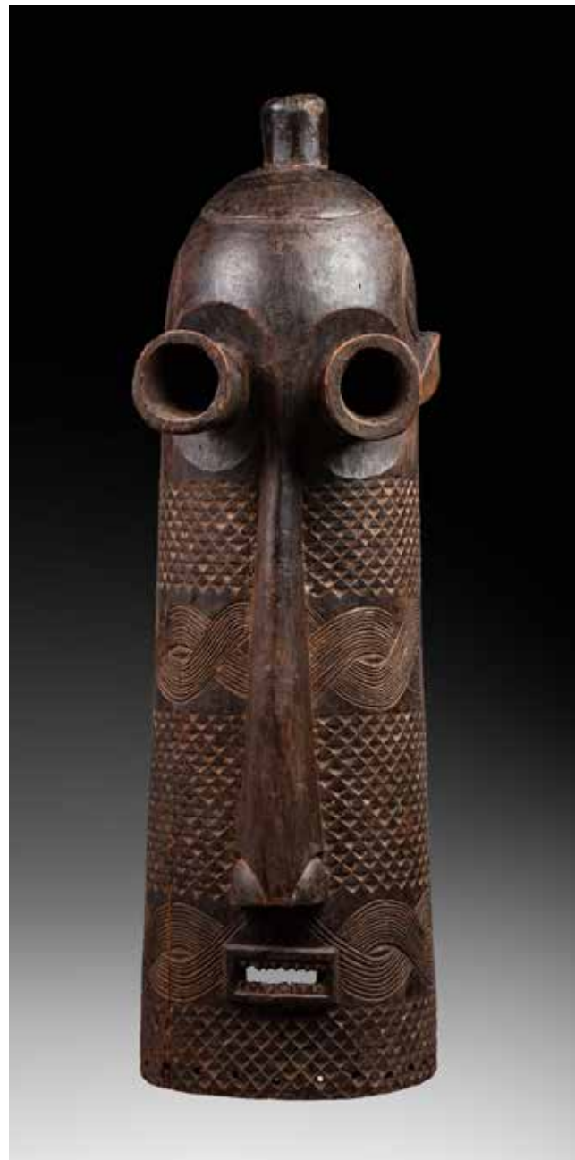
187 - Masque de danse « Panya-Yombé » présentant un visage avec des oreilles bovines faisant probablement référence à une divinité ancestrale. Bois, pigments naturels blancs, ancienne patine d'usage brune et marques d'usage internes. Pendé, République Démocratique du Congo, première moitié du XXe siècle 15 x 38 cm

Provenance Vente Sens-Enchères, Sens, 8 octobre 2005, lot 219