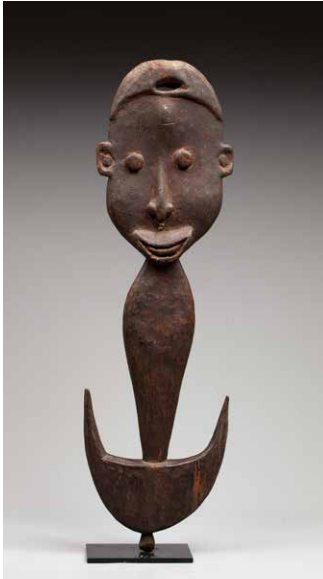
6 - Crochet cérémoniel présentant sur la partie haute une belle tête juvénile à l'expression enjouée et douce. Son nez est agrémenté d'un ornement en cordelette ; le regard est accentué par des petits yeux circulaires sculptés en relief. Bois dur avec ancienne patine d'usage brune et belles marques d'utilisation sur les crochets. Région du Moyen Sepik, Papouasie Nouvelle Guinée, fin XIXe - début du XXe siècle 71 x 21,5 cm Provenance ancienne collection Bonnefoy/Darcy Gallery NY années 1960-70 Exposé au musée d'ethnographie de Neuchâtel, Suisse du 27 juin au 31 décembre 1970 Vente Ader Picar Tajan Paris, 18 décembre 1990, lot 11 du catalogue Vente Christie's Paris, décembre 2003, lot. 54 du catalogue 4 000/6 000 €